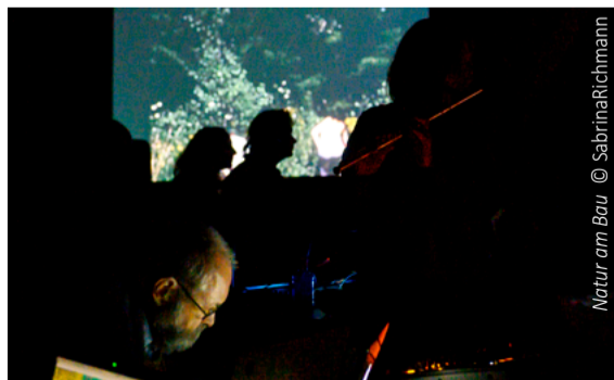
Natur am Bau